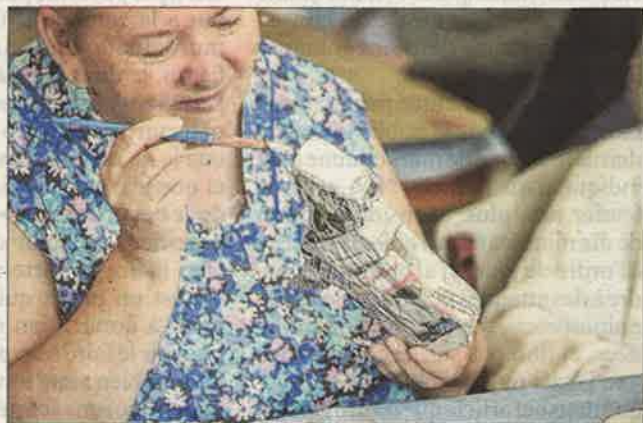
■ L'atelier arts plastiques bat son plein à l'Hôpital intercommunal de Grandris - Haute Azergues.