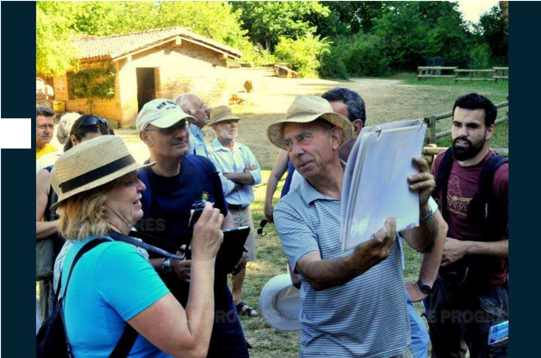
■ À l'été 2015, les experts sont venus auditer le territoire.

Profitez d'offres excep d'une PEUGEOT 308 AL Jours suréquipés PEUGEOT