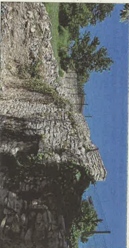
Les jeunes bénévoles mettront ce lieu, situé sur un côté de la carrière, en valeur.

PLUS d'informations sur le site officiel du projet : http://www.geopark-beaujolais.com/