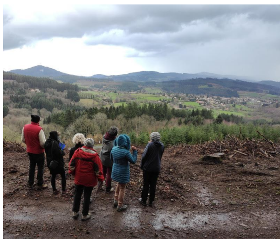
ateliers participatifs. Col des Écharmeaux.

A l'instant où ces lignes sont écrites, deux séances ont déjà eu lieu. Le 27 février, nous avons découvert quatre de ces lieux, l'église de Chambost, la roche des fées, Notre Dame de la Rochette et finalement le col des Écharmeaux. Cette journée a été synonyme d'échanges et de convivialité, les quatre participants présentant les sites avaient préparé les visites de manière aussi généreuse qu'assidue.