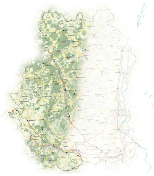
Périmètre de la zone d'étude

L'étude se tiendra donc sur la partie Ouest du territoire. (Voir carte).