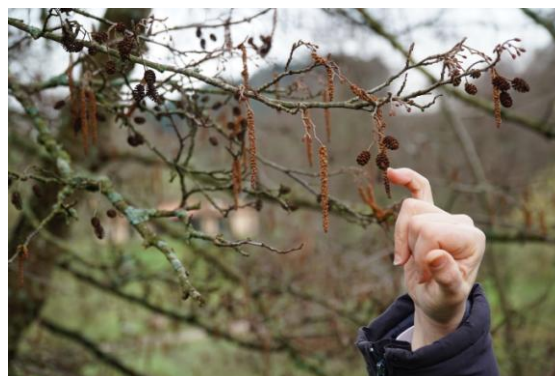
Fruit de l'Alne glutineux. Ateliers participatifs lac des Sapins.

Le 11 mars, nous nous sommes rencontrés une troisième fois pour découvrir la biodiversité végétale du lac des Sapins. De la même manière cette séance a été l'occasion d'échanges de savoirs et de partages bienveillants.